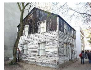
„Rosa Parks House“ Berlin