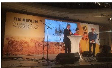
Grand Final ITB 2017

Als Alternative zu den QR-Codes, die immer häufiger überklebt oder zerstört werden, haben wir nun die King-Tour als „ Actionbound “ (Führung/ Spiel) gestaltet. Über die kostenlose App „Actionbound“ kann man die King-Tour über die Suchfunktion aufrufen und kann sich an die Orte des King-Besuchs von 1964 begeben. Die App verfügt über einen Stadtplan, der die Teilnehmenden zur richtigen Position führt. Die Führung kann von jedem beliebigen Punkt gestartet werden. In der deutschen Version gibt es auch kleine Quizfragen. Die englische Variante wird demnächst mit Quizfragen ergänzt. Der King-Tour-Actionbound verfügt außerdem über Links zu historischen Dokumenten wie Radiointerviews oder Filmsequenzen.