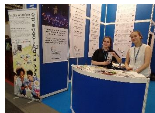
Schülerinnen präsentieren King-Code (ITB)