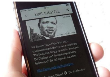
Spiel zur Ausstellung auf dem Smartphone