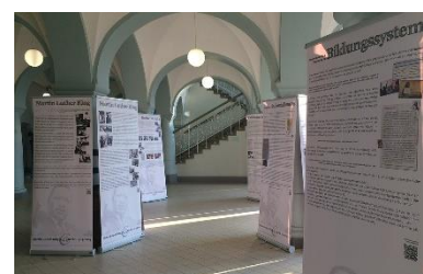
King-Ausstellung Schadow-Gymnasium 2017