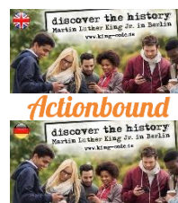
King-Tour mit Actionbound