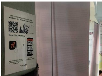
QR-Code - Actionbound zur Ausstellung

Die Schüler*innen des Berliner Schadow-Gymnasium konnten die Neuerung der King-Ausstellung bereits ausgiebig testen. Zur Ausstellung haben wir ein Quiz entwickelt, das die Besucher*innen allein oder im Team über ihr Smartphone spielen können. Über einen QR-Code in der Ausstellung und die kostenlose App „Actionbound“ geht's auf eine spannende Tour. Alle Informationen bzw. Antworten kann man sich über die Ausstellungsdisplays erarbeiten. Oftmals ergeben sich die Lösungen auch aus den Bildern oder Bildunterschriften. Die Ergebnisse und die Platzierung kann man sich am Ende einfach per Mail zusenden lassen.